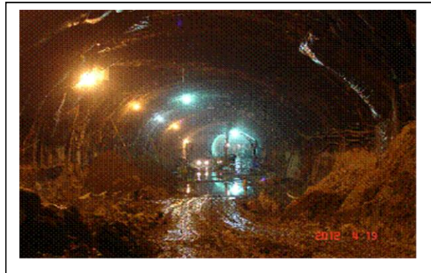
تونل نیایش حین ساخت

شده و پس از عبور از زیر بلوار آفریقا و خیابان ولی عصر در ضلع جنوبی پارک ملت و در بخش شمالی بزرگراه کردستان به بزرگراه نیایش می رسد. ارتفاع هر یک از تونل ها ۱۱/۷۵ متر و عرض آنها حدود ۱۴ متر می باشد. هر یک از تونل ها دارای دو خط ماشین رو و مسیر باریکتر امداد می باشد (۲/۵ خط). بیشترین میزان روباره در طول مسیر تونل در حدود ۵۲ متر است.