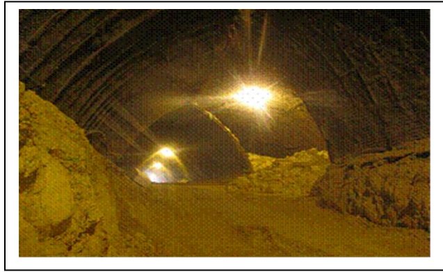
تونل فضيلت حين ساخت